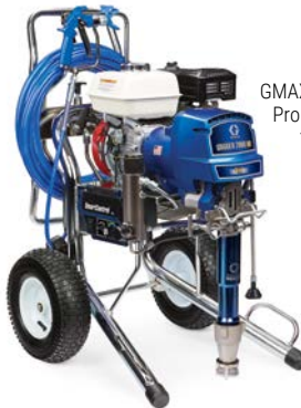
GMAX II 7900 HD ProContractor 17E842

选择正确的喷涂设备对您的业务至关重要。您需要一台可以处理当前工作, 但也可以通过扩展功能为您提供增长空间的喷涂机。有了 HD 喷涂机, 无论面对何种作业, 都能确保使用最合适的喷涂设备!