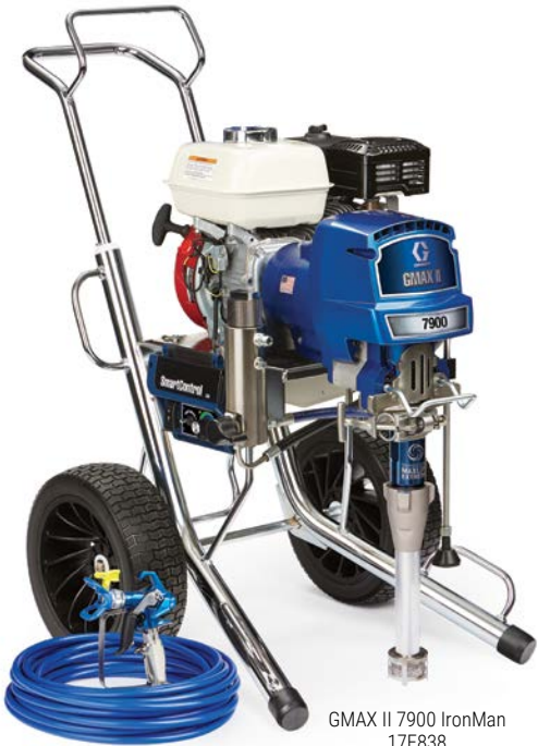
GMAX II 7900 IronMan 17E838