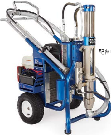
配备电启动功能的 GH 833 16U288