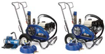
即刻投入喷涂：配备 Silver Plus 喷枪、50 英尺 Blue Max II 软管及 RAC X LP517 SwitchTip 喷嘴