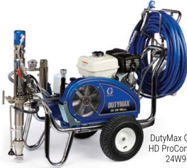
DutyMax GH 300 HD ProContractor 24W967