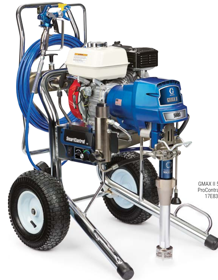
GMAX II 5900 ProContractor 17E832