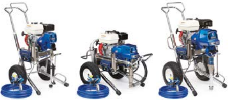
GMAX II 5900 标准 17E831