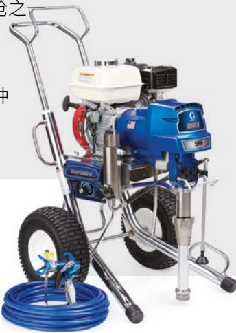
GMAX II 5900 ProContractor 17E832