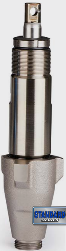
Endurance Chromex 泵 (适用于 GH 系列) 与竞品泵相比， 使用寿命多出 2 倍

固瑞克标准系列喷涂机以持久耐用和稳定性能，助您高效完成每周多个项目的涂装任务，表现始终如一。