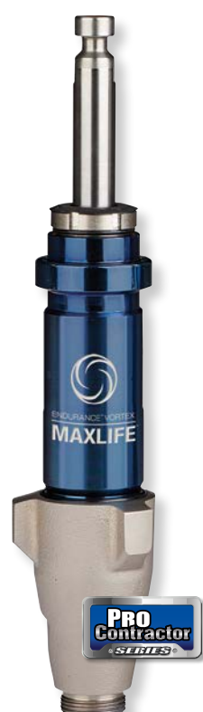
Endurance Vortex MaxLife 泵 两次更换填料之间的时长增加了 6 倍