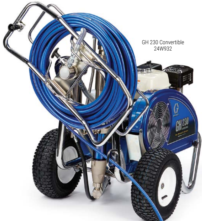
GH 230 Convertible 24W932