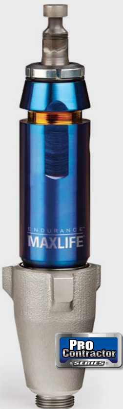
Endurance Chromex 泵 (适用于 GH 系列) 两次更换填料之间的 时长增加了 6 倍