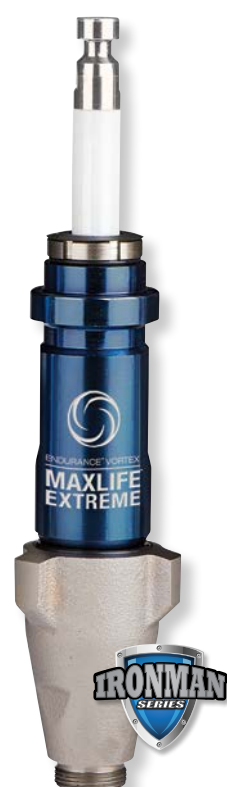
Endurance Vortex MaxLife Extreme 泵 泵杆使用寿命提升至原来的 3 倍 — 从而将拥有成本降至业内极低水平