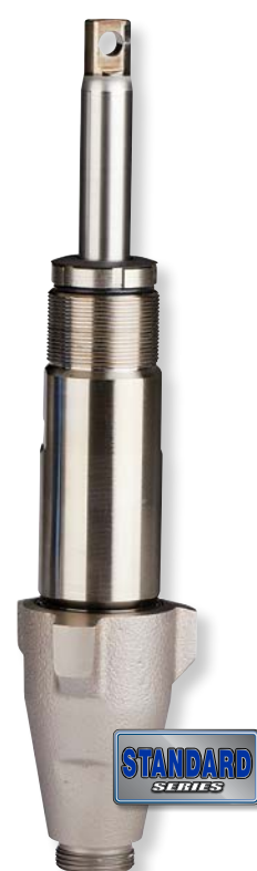
Endurance Chromex 泵 与竞品泵相比，使用寿命多出 2 倍