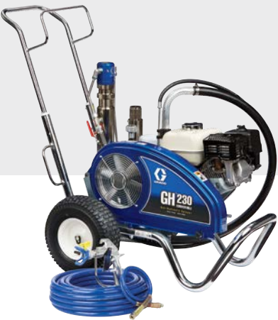
GH 230 标准版 24W929