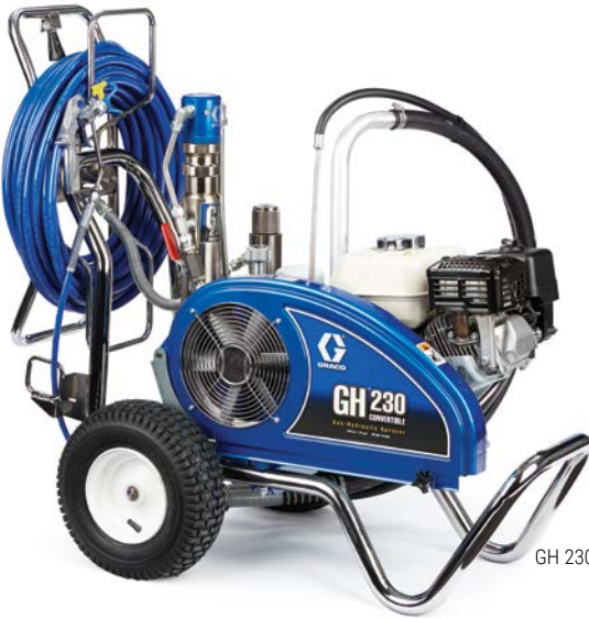
GH 230 ProContractor 24W932